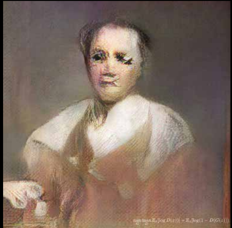
Obvious Art, L'Archevêque de Belamy, 2018

Tritt sich der Mensch im Cyborg also als einem mechanisierten Spiegel seiner Selbst gegenüber, der ihm lediglich an Geschwindigkeit und Kombinatorik von Wahrscheinlichkeitszuständen überlegen ist? Überrascht und überwältigt er uns mit seiner strahlenden Artistik schlicht und einfach und imaginieren nicht wir in ihn gerade wegen unserer Überraschung eine Lebendigkeit, die er gar nicht besitzt? Warum aber arbeiten Künstler mit KI? Was versprechen sie sich davon?